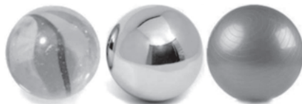
стъклено желязно пластмасово